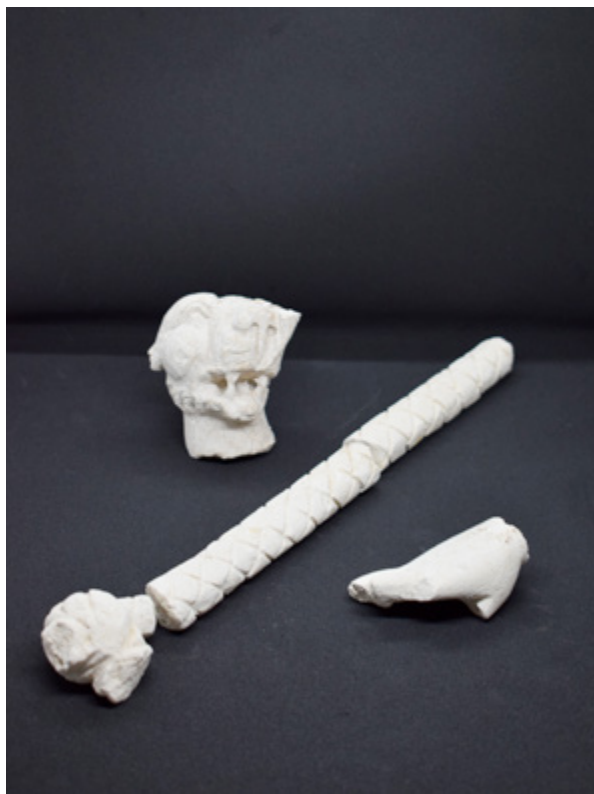
Groupe sculpté de Bacchus.