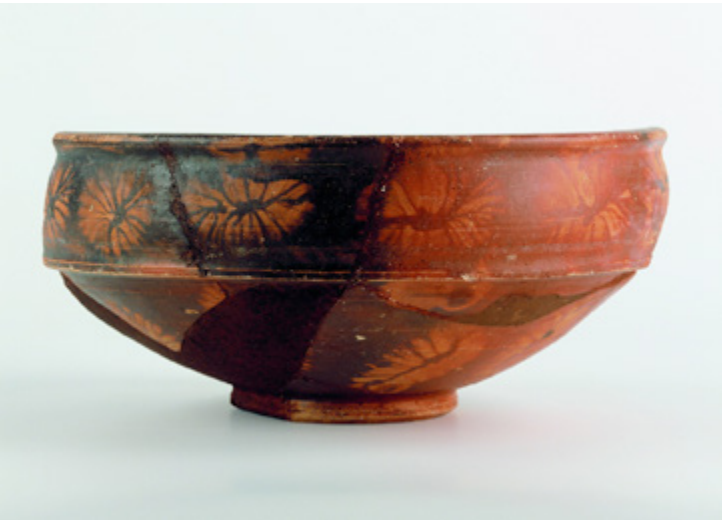
Coupe dite « à l'éponge » - Musée de Civaux.