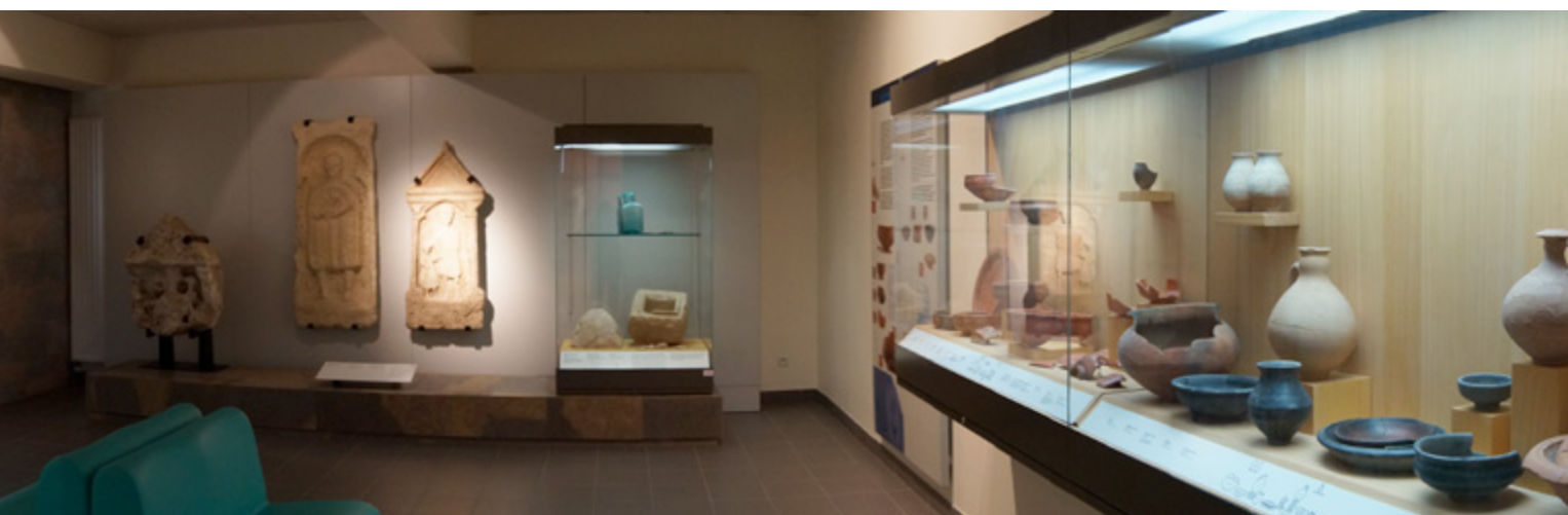
Salle gallo-romaine - Musée de Civaux.

De petite taille, l'artéfact du musée ne pouvait pas contenir de lait pour une tétée, à moins de le >>>