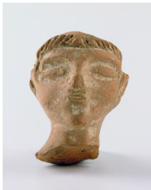
Tête de divinité.