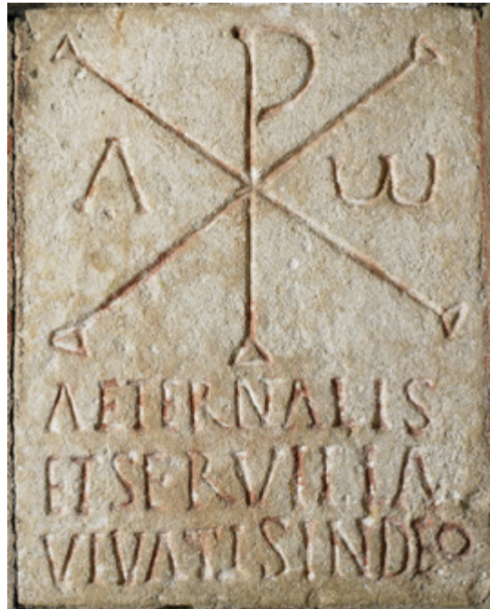
Stèle chrétienne de l'église de Civaux.