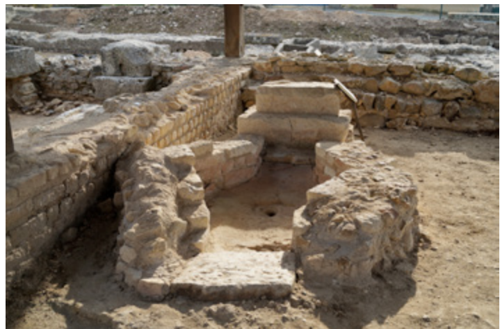
La piscine baptismale.

liées au dieu Bacchus, car le thyrses est son bâton, tandis que la panthère est son animal attribut. Il faut donc imaginer dans cette villa, dont la superficie est estimée à 7500 m 2 , la présence d'un groupe sculpté de Bacchus tenant le thyrses et accompagné de la panthère. D'autres objets, comme des serpettes de vigneron, découverts lors des fouilles, se rapportent à l'univers de la vigne. Bacchus étant le dieu de la vigne et du vin, sa place était tout indiquée au sein d'une villa vinicole.